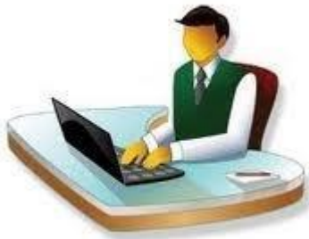
DIAGRAMA DE FLUJO. PERMISO AUTOMÁTICO DE IMPORTACIÓN DE CALZADO

Registra el Permiso Automático en la VUCEM y recibe Clave de importación