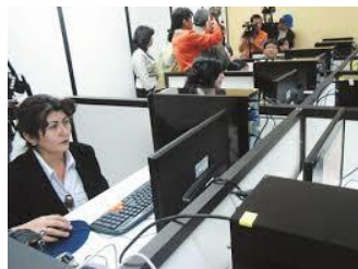
Ventanilla de Atención al Público (VAP)

El Área de servicios de la Representación Federal: