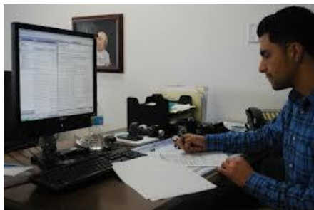
Ventanilla de Atención al Público (VAP)

El encargado del Área de servicios de la Representación Federal revisa que no haya inconsistencias entre los datos asentados en el permiso automático y la factura comercial o el documento de exportación.