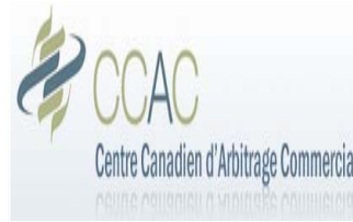
Centro Canadiense de Arbitraje Comercial